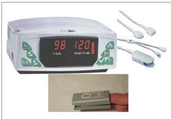
Figura 2. Oximetría de pulso.