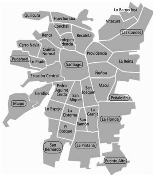
Figura 1. Mapa de Santiago, Chile. Comunas incluidas en el estudio (en círculos).

importancia de evaluar la desigualdad utilizando más de un indicador, en lo posible algunos de tipo absoluto y otros de tipo relativo. En este caso en particular, pese a haber aumentado la desigualdad entre ambas comunas en términos relativos, esta situación ocurrió en un contexto de reducción de la misma en términos absolutos, encontrándose ambas comunas (por separado) en una mejor condición que aquella registrada 16 años antes. La asociación directa entre el nivel de pobreza y la magnitud de la desigualdad en la TMI se reflejó también al comparar temporalmente el RA de diferentes comunas de la Región Metropolitana. A medida que transcurrió el tiempo, las comunas tornaronse más homogéneas en términos de su RA e índice de pobreza, confluyendo hacia un punto común de la gráfica (figura 2).